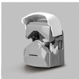
1. 向上掀开泵头翻盖，打开泵头。