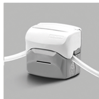
4. 向下合上泵头翻盖，完成软管安装。