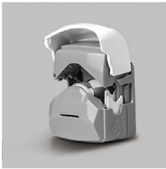
1. 向上掀开泵头翻盖，打开泵头。