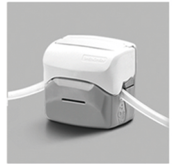
4. 向下合上泵头翻盖，完成软管安装。